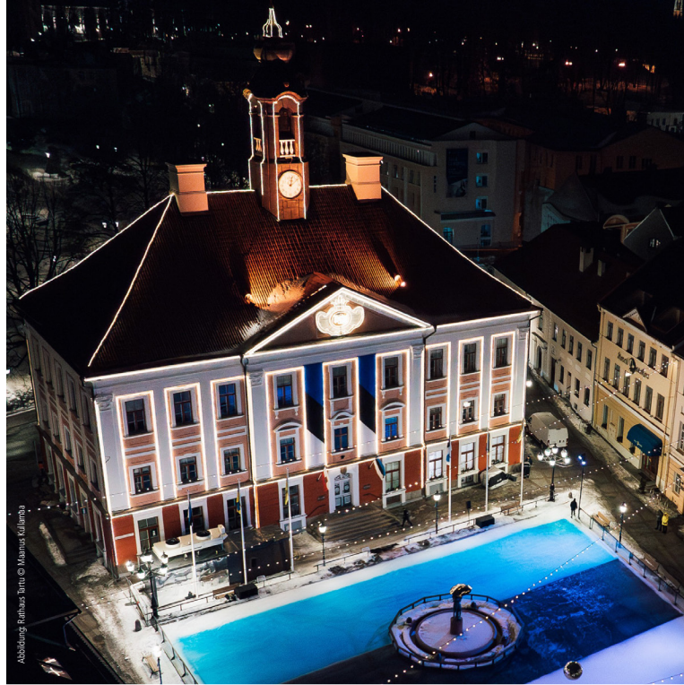
Abbildung: Rathaus Lüne